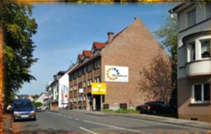
Foto innen und außen v.l.n.r.: © eyetrönic-fotolia.com; Gebäude: Tom Weber